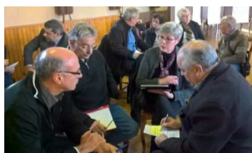
Des moments de réflexion et d'échanges