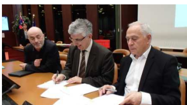
30 novembre 2015 : signature de la convention LEADER avec la Région