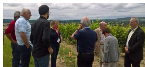
Des visites du territoire