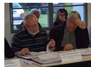
7 Comités LEADER depuis 2015 : à l'étude des projets