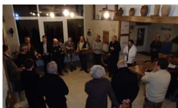
17 décembre 2015: 1 ère réunion du Comité LEADER